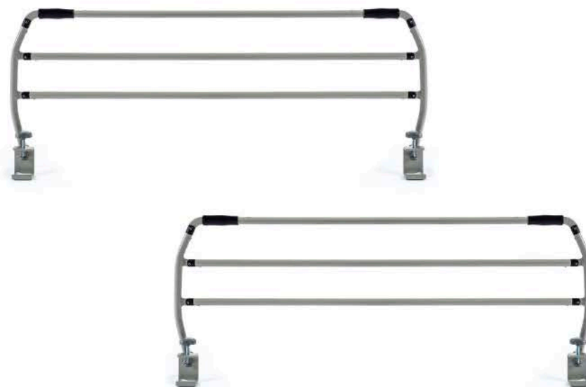
JUEGO DE CABECERO + PIECERO